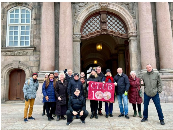
Club100 och DBK framför Christiansborg