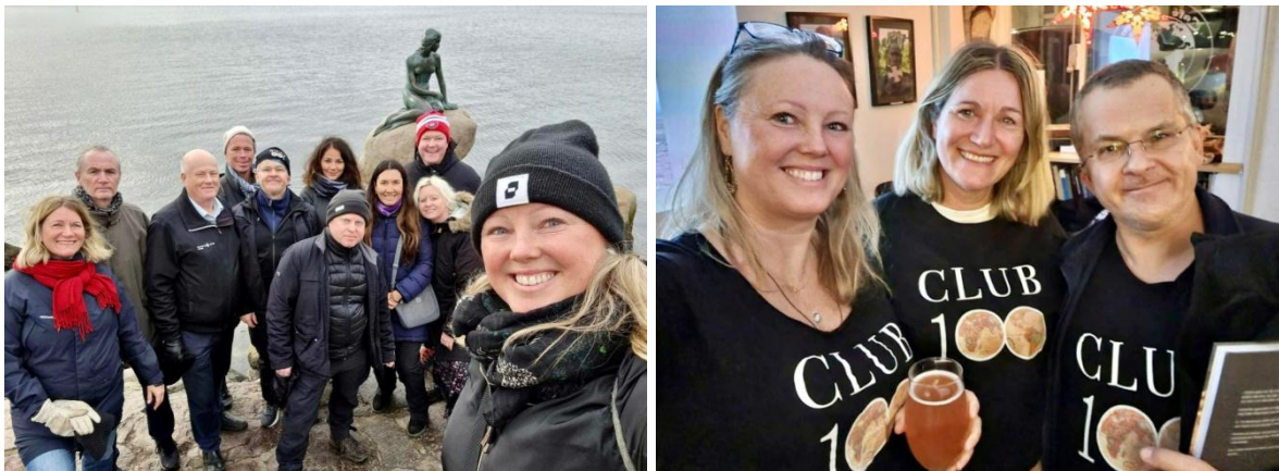
Club100 & DBK vid den lille Havefrue