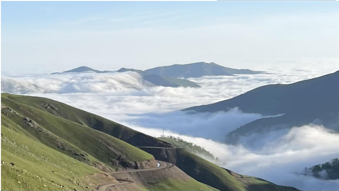
Uppe i bergen, högt ovan molnen