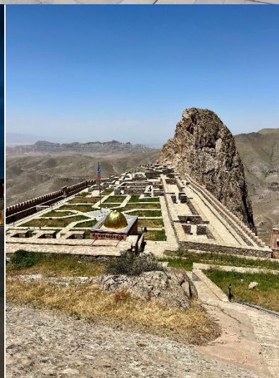
Nakchevan - med Noaks mausoleum, krigaren Babak, ett vackert torg och Alinja – "Machu Picchu"