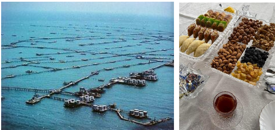
Neft Daslari – Oil Rocks

Först blev det emellertid en specialutflykt till Neft Daslari (Oil Rocks), som är ett system av sammanlänkade olje- och gasplattformar, med bostadshus, vägar och annat, beläget någon mil ut i Kaspiska havet från Baku. Anläggningen började byggas redan på 1940-talet, då i sovjetisk regi. Den har sedan dess expanderat till vad vi ser idag. Närmare tvåtusen personer arbetar skiftvis på plattformarna idag. Endast dessa arbetare och vissa myndighetspersoner har tillstånd beträda området. Vi var, förutom en mindre grupp häromåret, den första gruppen "turister" som hedrades med äran att se denna mycket speciella plats. Vårt besök sammanföll av en slump med den sedan länge avlidne förre presidentens, Heydar Alijev, imaginära hundraårsdag, vilket gjorde att det var lite extra högtidligheter på programmet. På kvällen hölls välkomstmiddag med traditionell mat på en restaurang i Baku till vilken även de i gruppen som anlät under dagen anslutit.