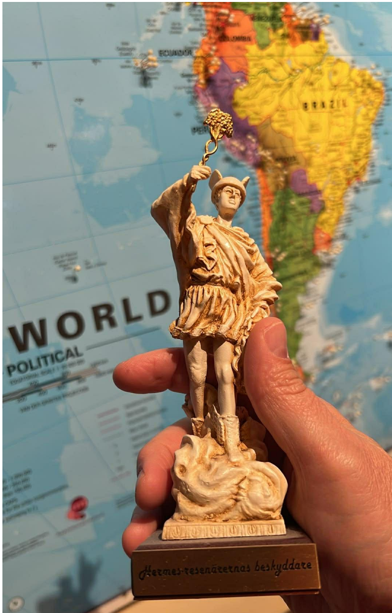
Hermes-statyetten, med passande bakgrund