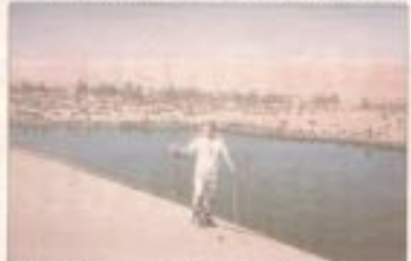
Slavdövning på sanddyner i Libyen år 2004.