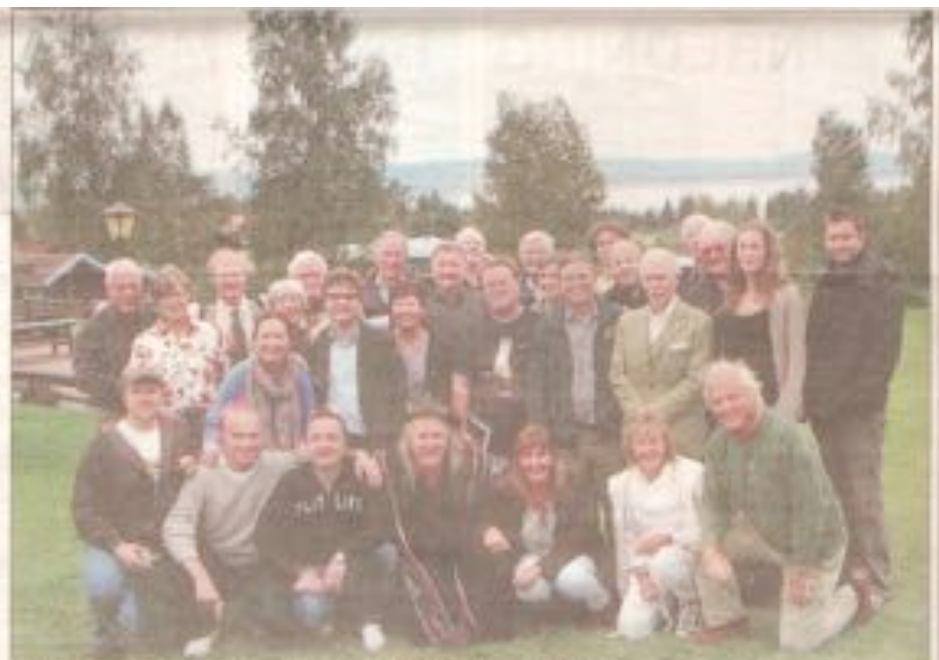
De flesta av de 23 deltagarna vid Club 100-årsmötet i Vikarbyn, Rättvik, nyligen.