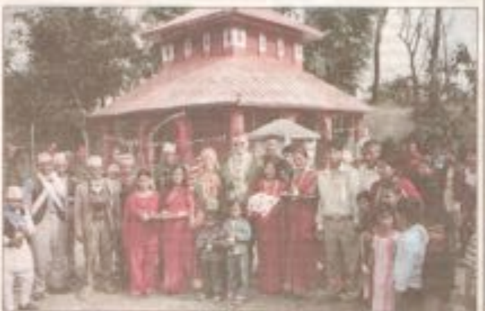
Ärklöpp i Nepal 2005.

När årsmötet hade avvecklats i Vikarbyn äkte var och en av de deltagarna hem till sitt. En del närmare