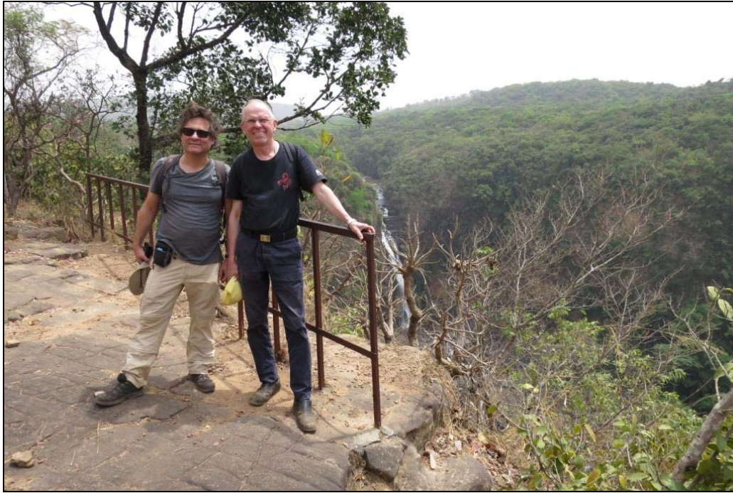
Vid fallen i Salaa