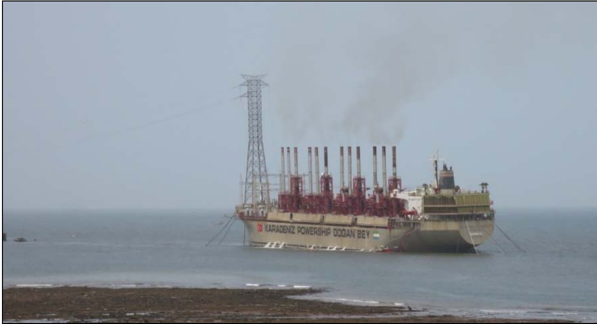
Powership Dogan Bey

Ny taxiresa mot en ny gräns, denna gång satt vi i taxin från 06.30 till 17.00, tämligen jobbigt eftersom vägen efter gränsen var väldigt dålig. När vi närmade oss huvudstaden Conakry tilltog trafiken också och det tog över en timme att komma fram de sista kilometrarna till vårt hotell, Pension Les Palmiers, återigen vid Atlantens strand.