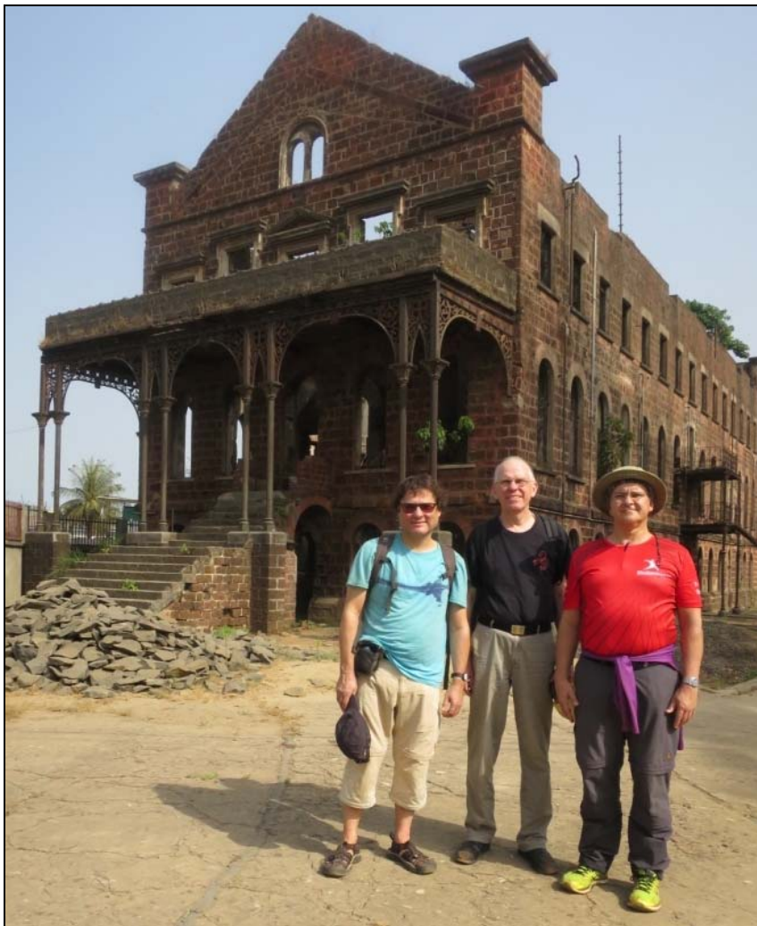
Tre resenärer i Freetown