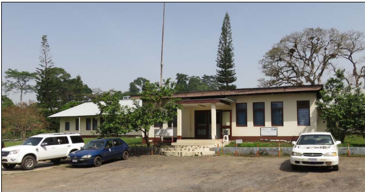
Svenska sjukhuset i Yekepa