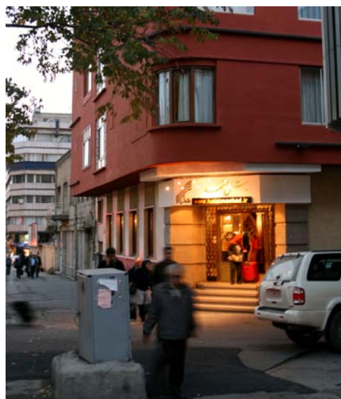
Mitt hotell i Tehran

Ska ta Qatar Airlines på morgonen 09:45. men här vill man dra mitt Mastercard vilket är nytt sedan jag bokade och betalade flyget den 11 juli. Vägras därför incheckning och får bokat nytt flyg och tappar 12 timmar. Tillbringar många timmar på flygplatsen i Kuwait samt 4-5 timmar på flygplatser i Doha (Qatar) där jag mellanlandar. Landar därför på morgonen i Tehran och når Hotel Mashad kl 05:00. Sover 2-3 timmar. Hotellet ligger tre stationer från deras T-central Iman Khomeini.