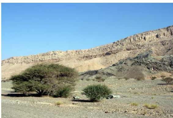
På jakt efter cachen

Inne i Oman försöker jag mig på den första cachen. Parkerar bilen på vägrenen väl synligt. Går 400 meter rakt ut med bilen i sikte hela tiden. Orolig för att någon ska stanna vid bilen. Lyckas inte hitta ca-