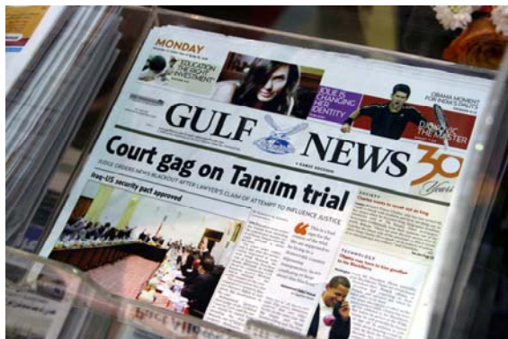
Lokalblaskan i Gulfen

Landar i Dubai med Norwegian kl 23:55. Upp-täcker att jag landat i terminal 2 som ligger på andra sidan rullbanan i förhållande till terminal 1 och 3. Terminal 3 är bara till för Emirates Airlines och 3:an är liten och till för lågpris-flyg och annat löst folk.