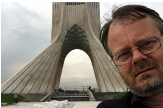
LGG och Azard-tower

Köper Metrobiljetter för att ta mig till Azard tower (Frihetstornet). Går av på Metrostation med samma namn, men ser tornet flera kilometer bort. Gör ett försök att åka några stationer till men ser inte tornet varför jag åker tillbaka till Azard-stationen och promenerar därifrån.