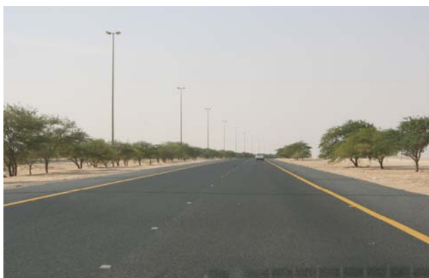
På väg mot Saudi Arabien

Plockar tre cacher utefter stranden i Kuwait City. Åker också upp i Kuwait Towers, vattentorn med restaurang och utsiktspunkt i hamnen.