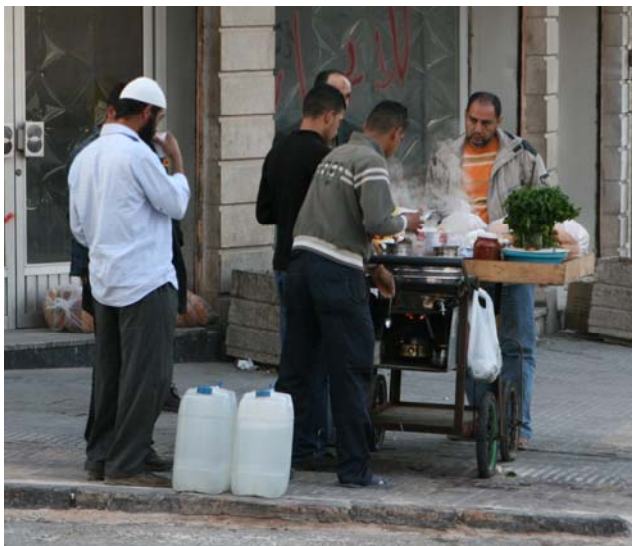
Jordansk frukost på gatan

Är i god tid på morgonen. Hinner ta en frukost vid ett "gatukök".