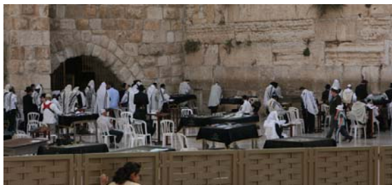
Klagomuren (Western wall)

Använder dagen till att gå runt i old city och åter gå till klagomuren. Samt ta en cache och lägga en cache i närheten av old city. Letar mig också fram till Budget-biluthyrning.