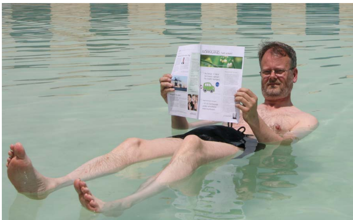
Döda havet, + 42 grader i skuggan

På vägen dit har Israelerna packat just ihop efter en övning med pansarfordon och stridsvagnar.