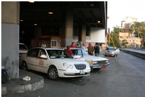
I väntan på fler passagerare

Väntar där till sextiden och tar sedan en taxi till busstationen Charles Helou i norra delen av Beirut. Där finns flera taxibilar som väntar på passagerare till Damaskus och Amman. 45 dollar för en plats eller 180 för hela bilen det är priset om man vill med. Gör upp om 45 dollar och väntar på fler passagerare. Efter en timma kommer nästa, en kvinna som sätter sig i bilen och väntar likt jag. Efter en timma ger hon upp och försvinner. Blir lite orolig,