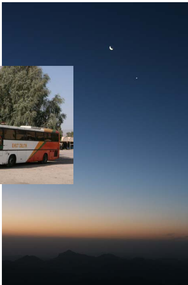
Gryning på Sinai

ningen. Här upp finns ett hundratal personer. Vissa har övernattnat i sovsäckar. Det tar 2 timmar att gå ned. Av någon anledning besöker vi inte klostret St Catherine. Vidare tillbaka till Dahab. Slår ihjäl mer tid för att sedan vid 13.00 tiden dela en taxi till Sharm airport. Planet går 20:15 till Gatwick.