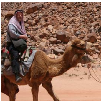
Lawrence of Nyköping

Drar in till Rum village och får tag på en kamel för en tur. Vi rider till Lawrence Spring. Min guide är en pojke i Jacobs ålder, 11-12 år. Han rider egen kamel vilket kostar mig 10 dinarer extra. Efter 3 km är vi framme. Där finns ett beduintält där det bjuds på te och vila. Sedan 3 km hem också. Tar ca 1,5 timmar. På slutat börjar grabben djävlas