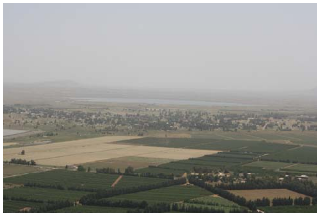
Utsikt mot Syrien från Merom Golan

Denna dag kör jag rätt. Väg 90 mot Jordanien inkl en sväng in i Jericho där jag letar efter muren som föll. Men besöksnäringensinfrastrukturen är obefintlig och muren hittas inte. Vid gränsen frågade man om jag var turist vilket jag bejakade. Man tittade mistroget på mig. Jag har tillåtelse att besöka Palestinsk territorium men inte bilen. Hade det hänt något hade jag fått stå för hela skadan själv.