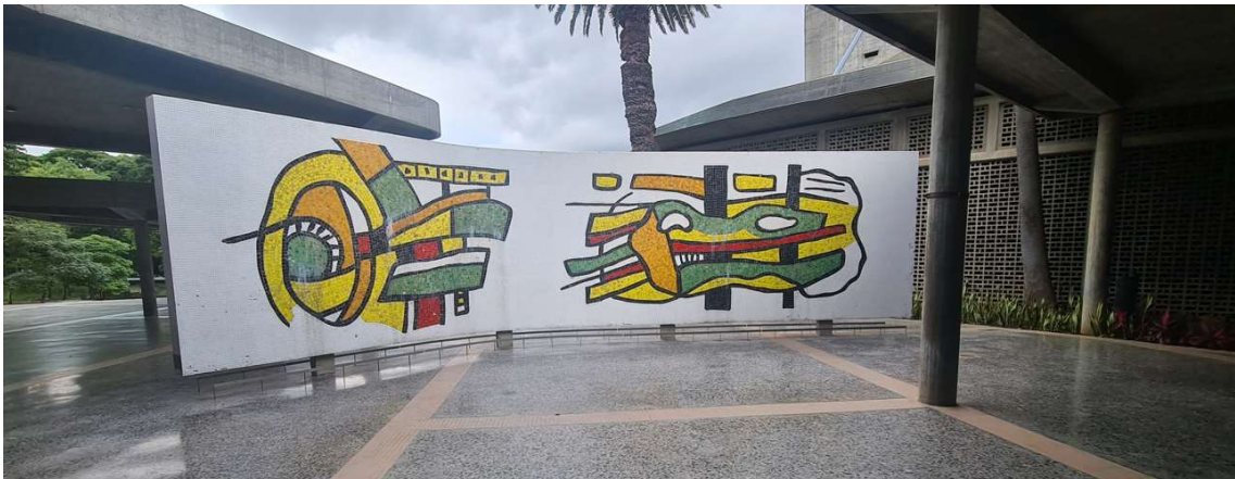
Väggmosaik från universitetsområdet i Caracas (för övrigt utnämnt av UNESCO som världsarv)

Klimatet i Caracas är behagligt. Staden ligger i en dal några mil från kusten på cirka 1000 meters höjd vilket säkerställer en jämn temperatur runt 25 grader hela året.