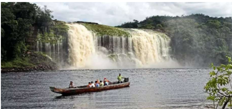
Fallen i Canaima som man kan gå bakom hela vägen och den typ av båt som används på floden

Vi bestämde oss dock för att besöka Angel Falls. Fallen är uppkallade efter den amerikanske äventyraren och guldletaren Jimmie Angel som ”upptäckte” fallen långt inne i djungeln när han letade efter guld på 1930-talet. Angel Falls faller 979 meter från tepuiberget Anaoytepuy rakt ner i regnskogen. Under torrsäsong är vattflödet så svagt att allt vatten blir till dis och försvinner innan det når botten och under regnsäsong kan fallen vara så fulla av vatten att de knappt går att se för diset (även om det mesta vattnet då når ner till botten). Dessutom gör lokala väderfenomen att fallen ofta är täckta av moln.