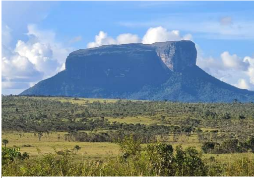
Ett av cirka 200 tepuiberger

Av de 200 bergen är det bara cirka tio som är möjliga att bestiga för människor (och därmed även för landlevande djur och även växter). Övriga har under miljontals år varit helt isolerade från omgivningen och på toppen har det utvecklats helt egna ekosystem med endemiska arter som bara finns där. Uppe på toppen är det natur som liknar våra fjäll medan det bredvid ofta är regnskogar nära bergen och sedan savanner längre ifrån. De stora nivåskillnaderna skapar också intressanta mikroklimat.