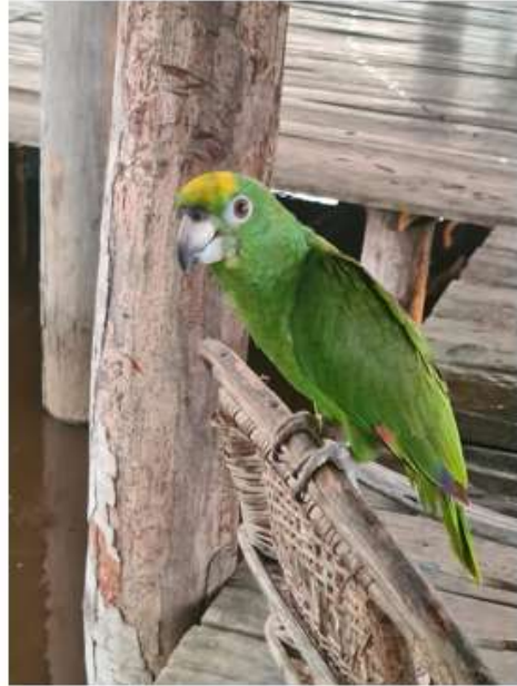
En grön ara hälsade på en frukost